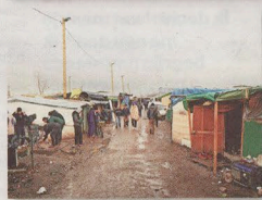
▲ Wildschut fotografeerde Calais in al zijn facetten. * Kaal was het er, kaal is het er opnieuw, rond de havenstad.